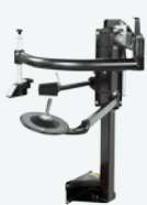
HP2 - 93Y005000 x 1