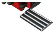
Roller board Kit rulliera