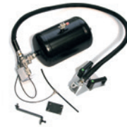
Tubeless inflation system (only on version with pedal-operated inflating device) Sistema di gonfiaggio TI (solo su versione con gonfiaggio a pedale)