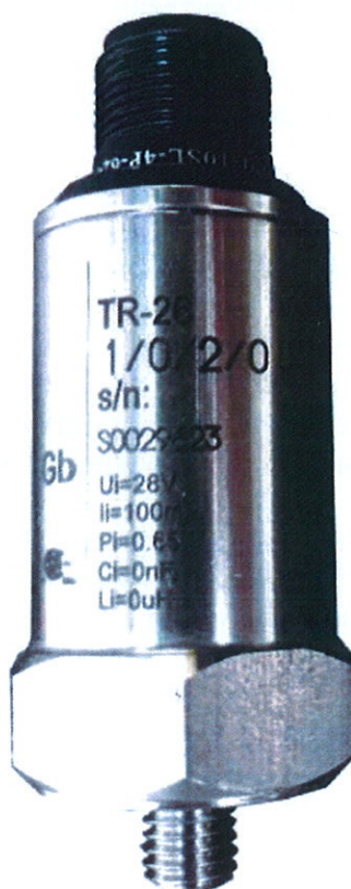
Рисунок 1 – Общий вид вибропреобразователя модификации TR-26

Общий вид вибропреобразователей модификаций TR-26, TR-27, TR-I представлены на рисунках 1-3.