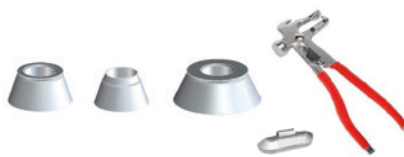
KIT 3 CÔNES - 41FF034416 Ø 45÷110 mm, pince-marteau et poids de 60 g